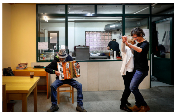
VILLAR LÓPEZ Lugar de encuentro para personas sin hogar.